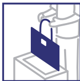
服飾雑貨 バッグ(エナメル含む)、 タオル、靴下など