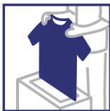
衣類 Tシャツ、 インナー(アンダーシャツ)、 ジャージ、ヒステ、 トレーニングウェア、パーカーなど