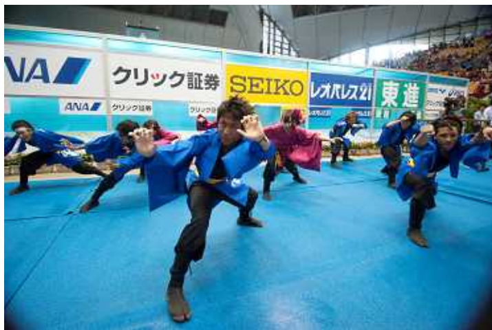
▶ 9月4日(土) / 法政大学よさこいソーランサークル鳳遙恋