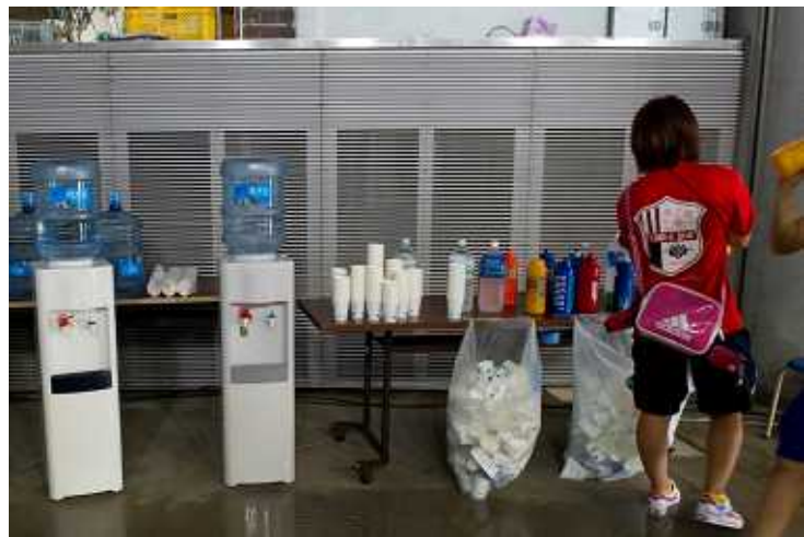
▶ ウォーターサーバー (PETゴミ大幅減少)