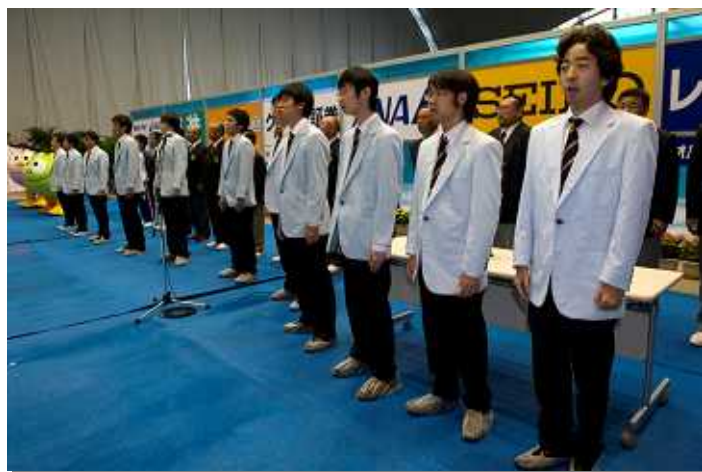
国歌斉唱 / 法政大学アリオンコール