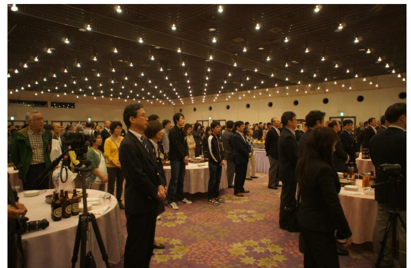
懇親会会場の様子