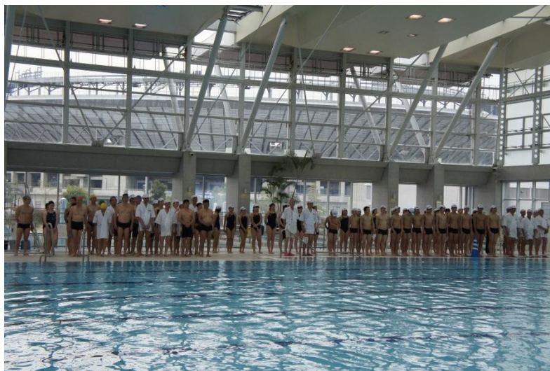
実技披露者全員で挨拶