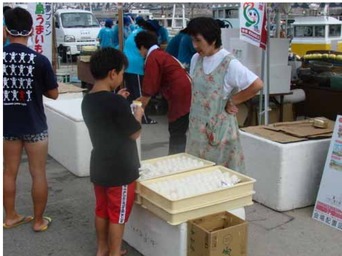
「NPO いえしま」による朝食のおにぎりの無料配布