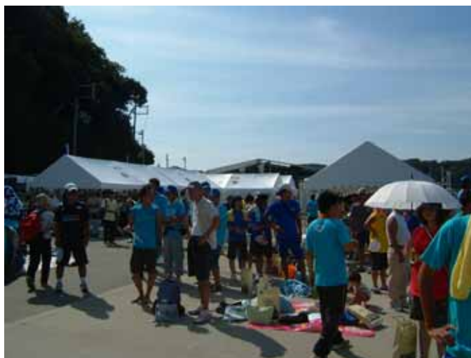
開会式前会場風景