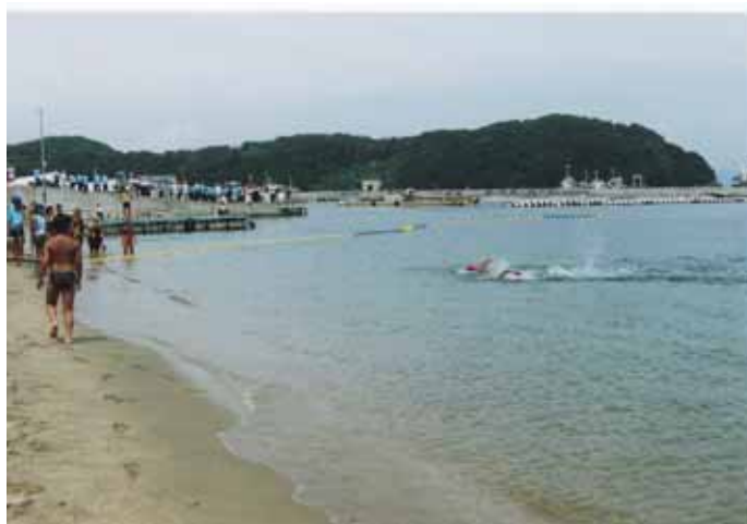
3.2 km 1位争い