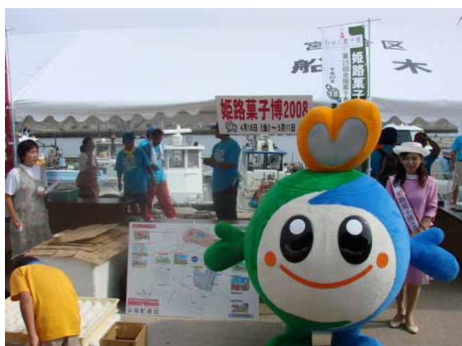
姫路菓子博 2008 展示ブース