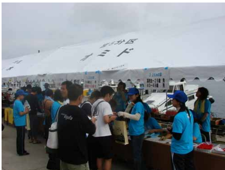
参加賞等引渡し状況