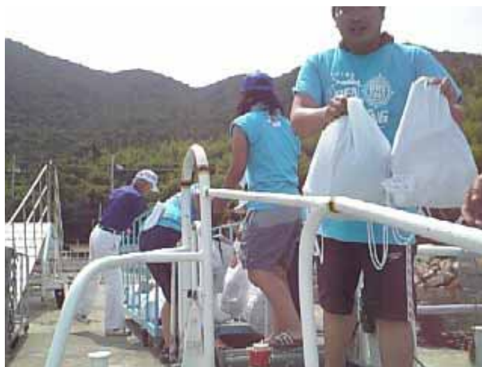
男鹿島立の浜より選手の手荷物を移動