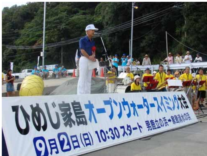
姫路市長 石見利勝氏による挨拶