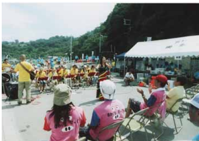
閉会式前、新日鐵広畑「尚和会吹奏楽部」によるジャズライブ