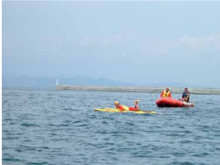
レースガードスタッフ（レスキューボード）