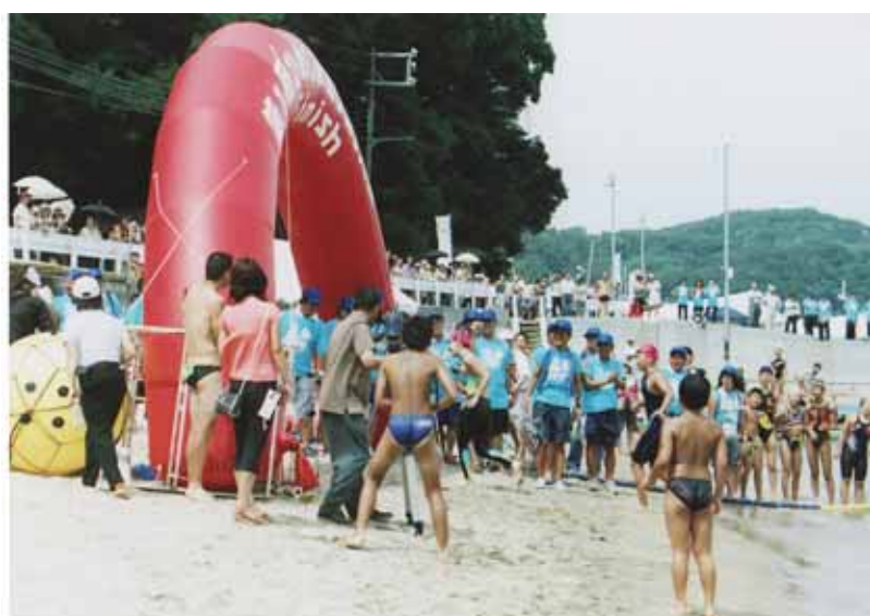
3.2 km 1位争い