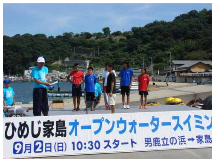
1 k mの部表彰