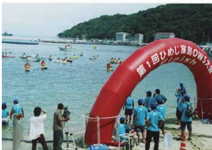
最後の一人ゴール直前