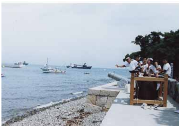
ゴール直前に太鼓を鳴らしての応援 協力：家島中学校