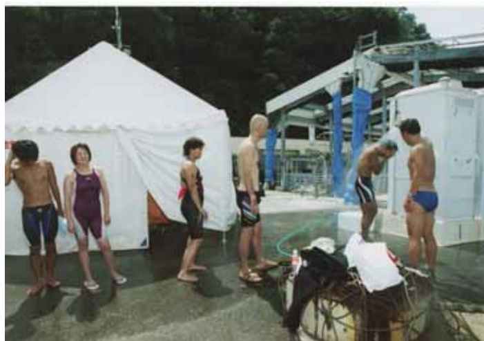
男子更衣テント前シャワー