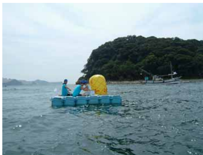
競技スタッフ（給水係）