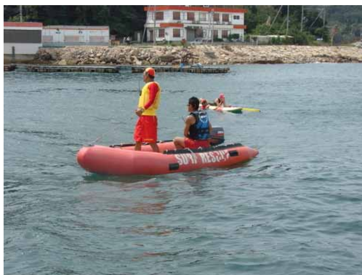
レースガードスタッフ ( I R B )