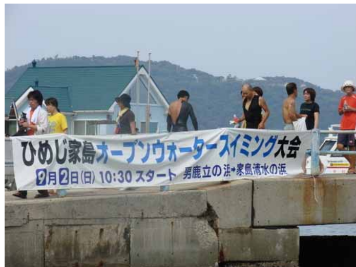
横断幕（男鹿島立の浜）