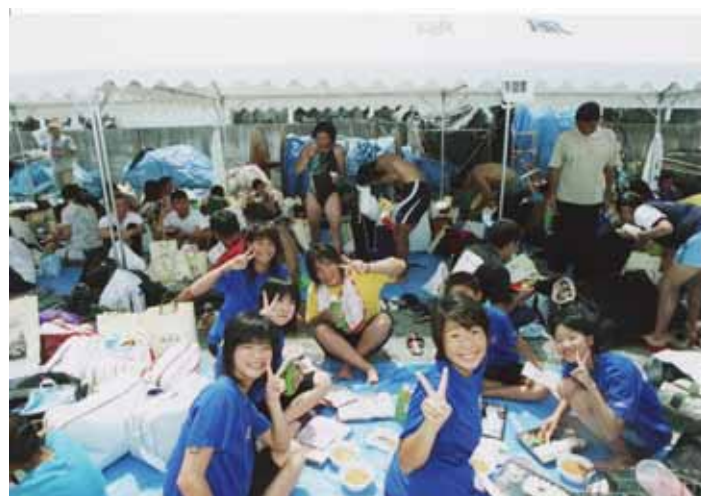
選手控えテントでの昼食