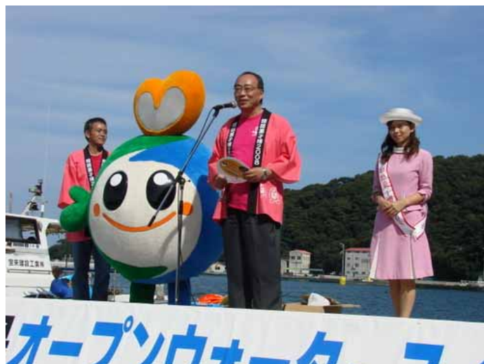
姫路菓子博 2008 のプレゼン