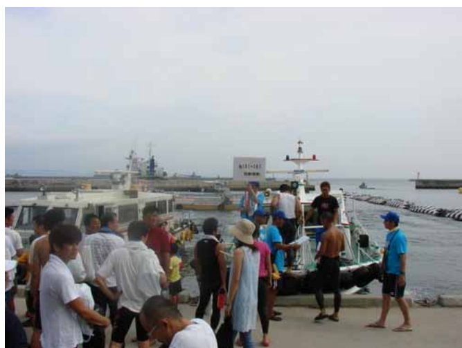
家島から男鹿島への選手移動状況