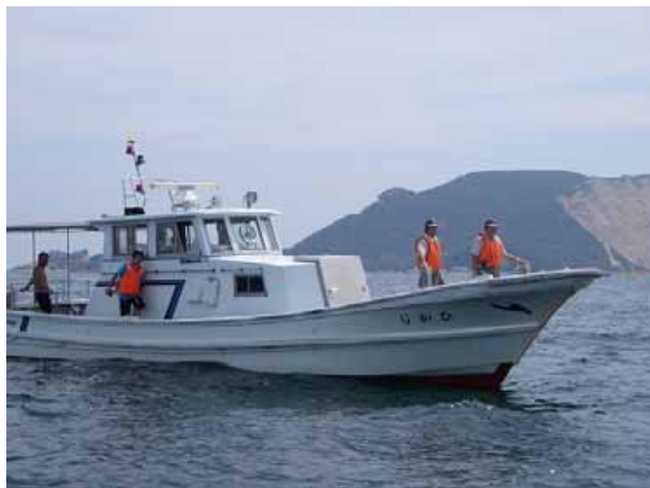
レースガードスタッフ（救助船）