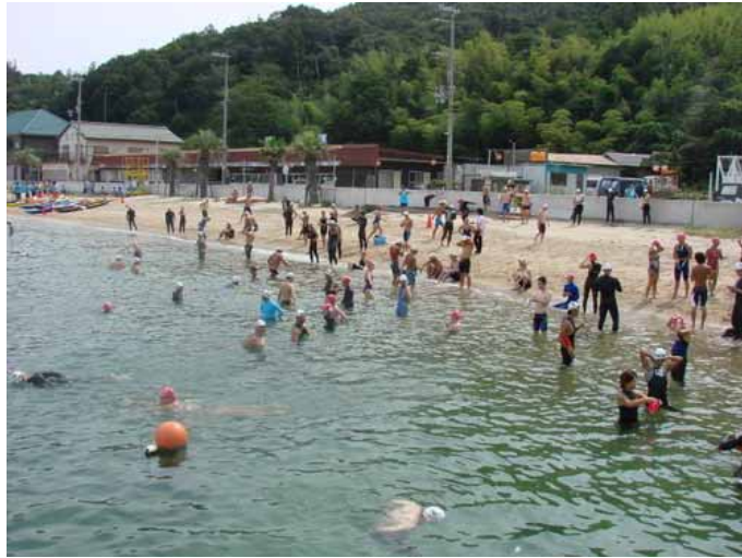
ウォーミングアップ状況