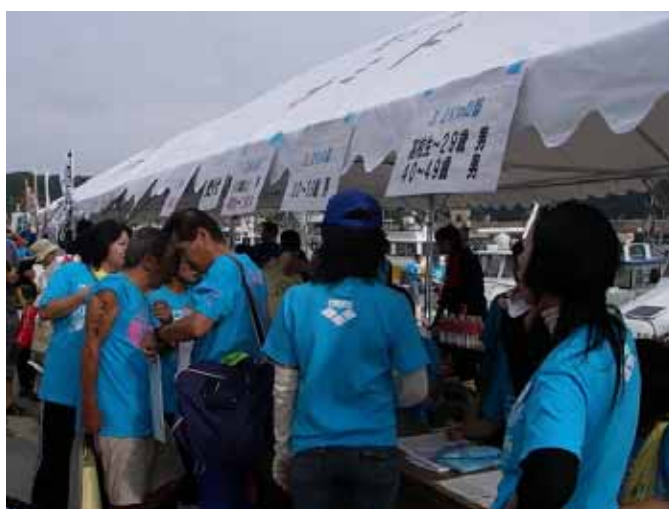
受付状況 (ナンバリング)