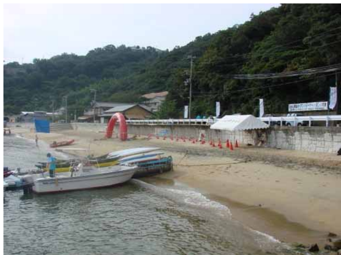
清水の浜（栈橋・救助船係留状況）