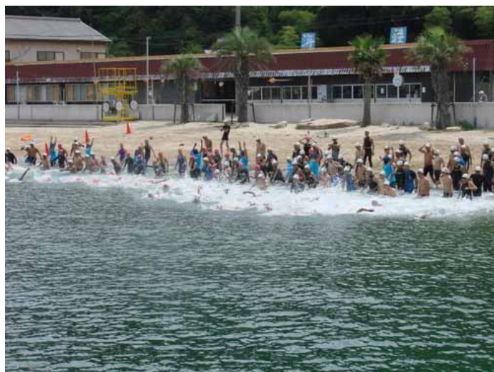
3.2 km スタート