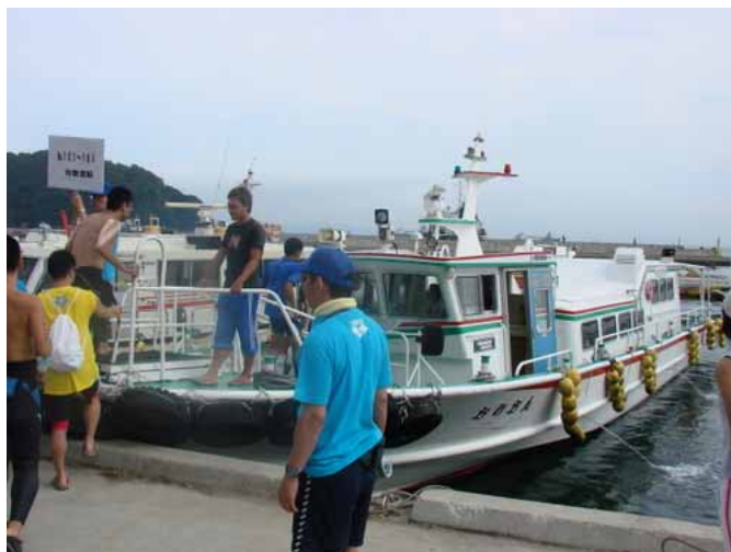
家島から男鹿島への選手移動状況