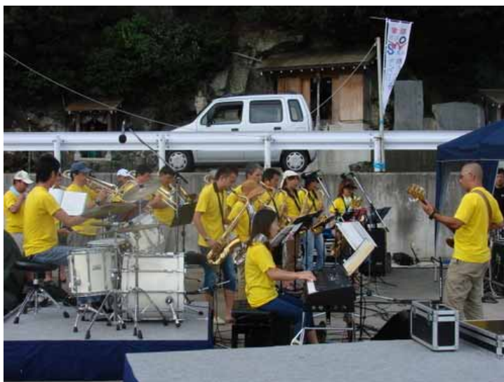
開会式前、新日鐵広畑「尚和会吹奏楽部」による生演奏