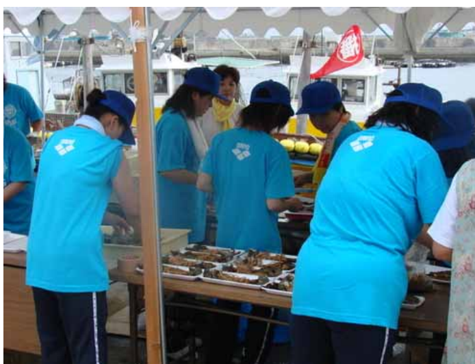
「NPO いえしま」より地元の海産物の料理の無料配布