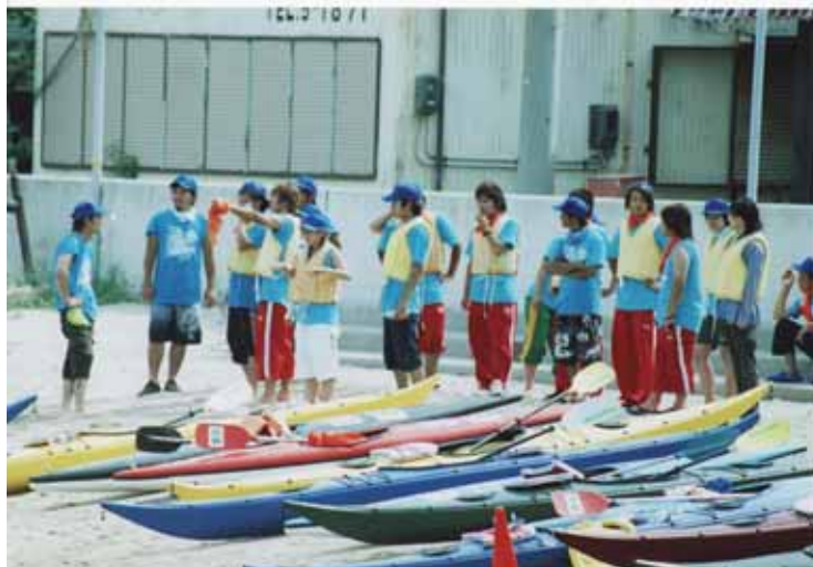
レースガードスタッフ（カヌー）