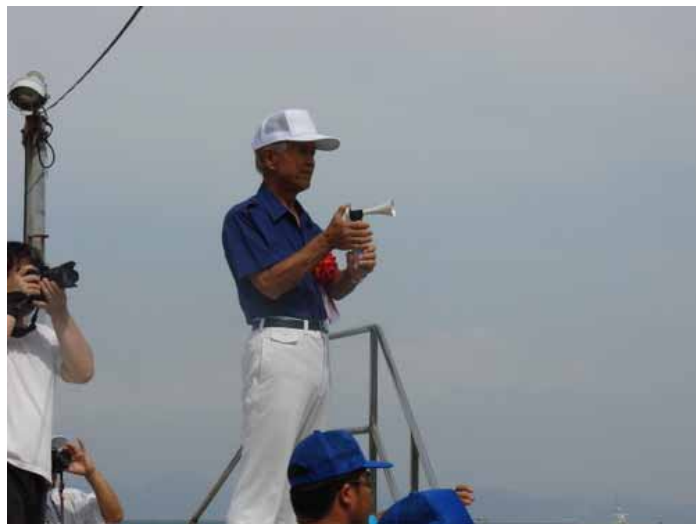
3.2 km スターター 姫路市長 石見利勝氏