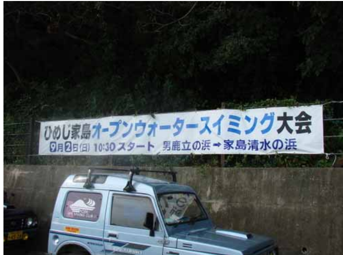
横断幕（家島清水の浜）