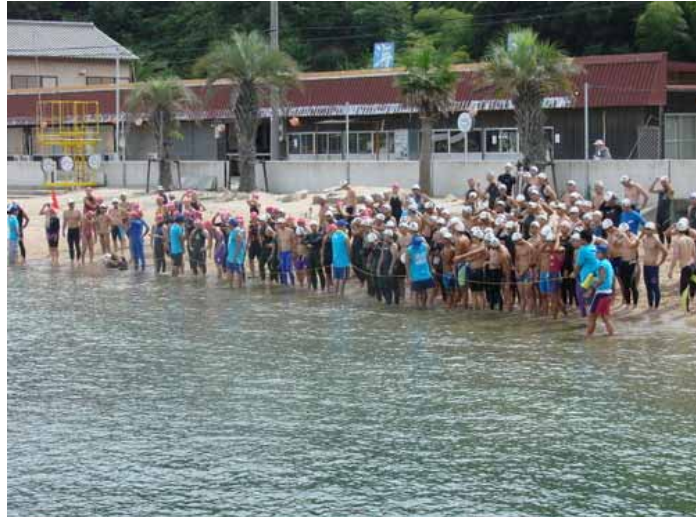
3.2 km スタート直前