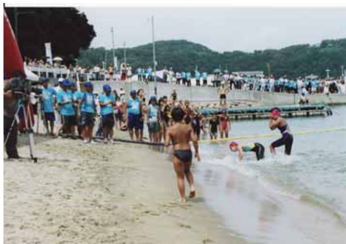
3.2 km 1位争い