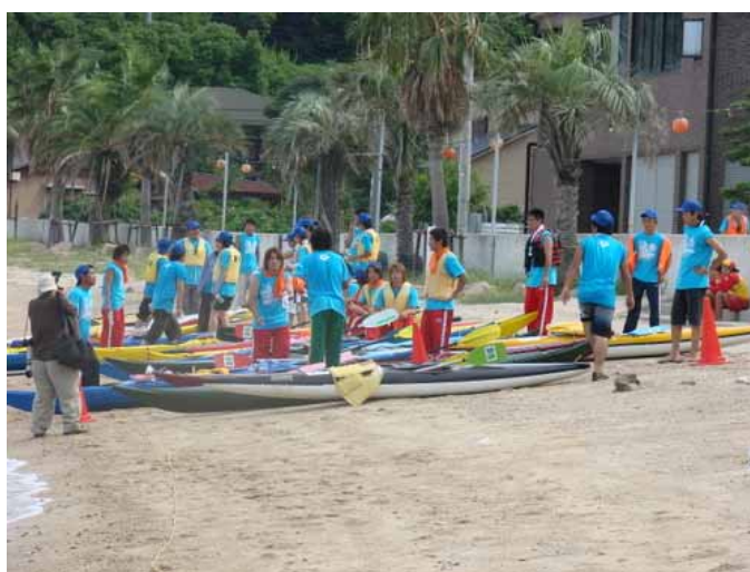
カヌー・救助船スタッフ（男鹿島立の浜）