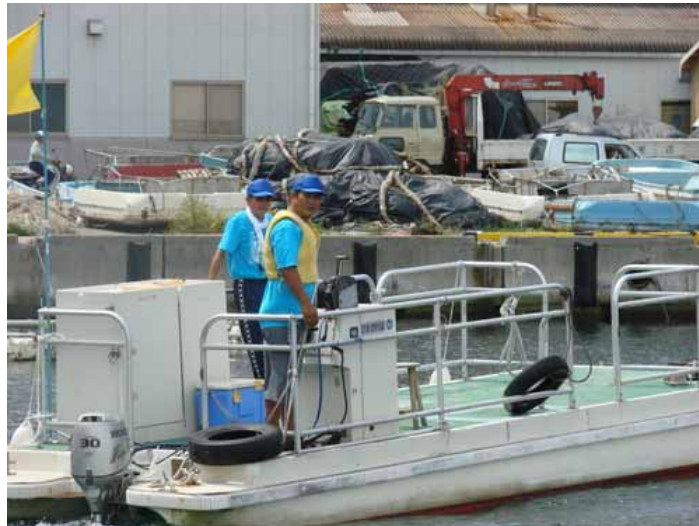
レースガードスタッフ（先導船）