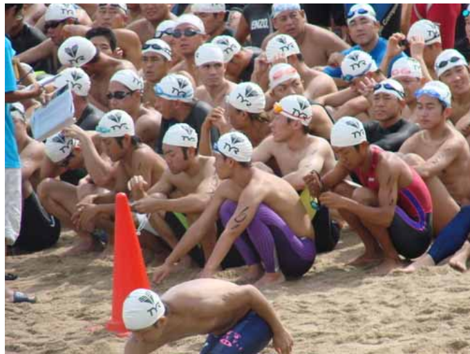
3.2 km スタート前