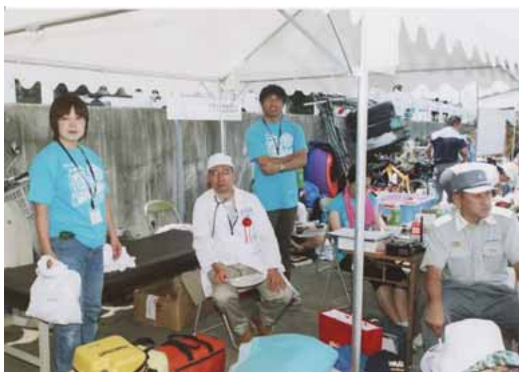
医事救護スタッフ