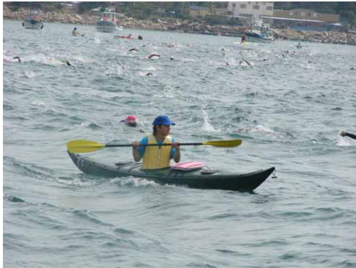
レースガードスタッフ（カヌー）