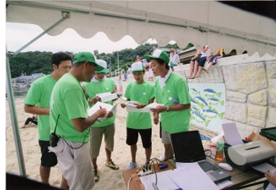
ゴール担当打ち合わせ風景