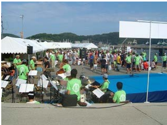
開会式前選手召集風景