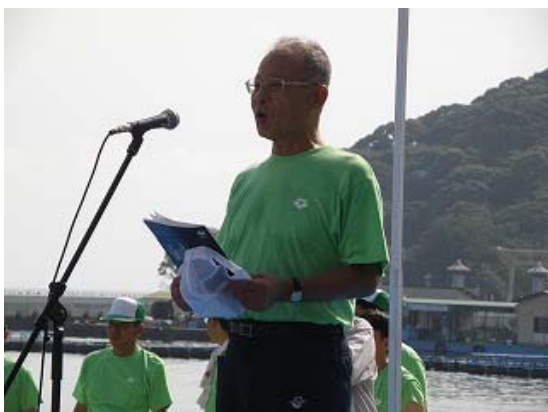
碓大会副会長開会宣言