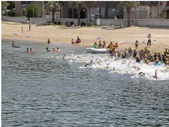
3.2km コース スタート