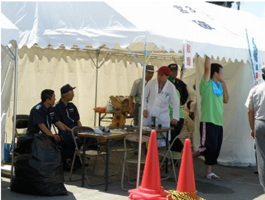
医事救護スタッフ