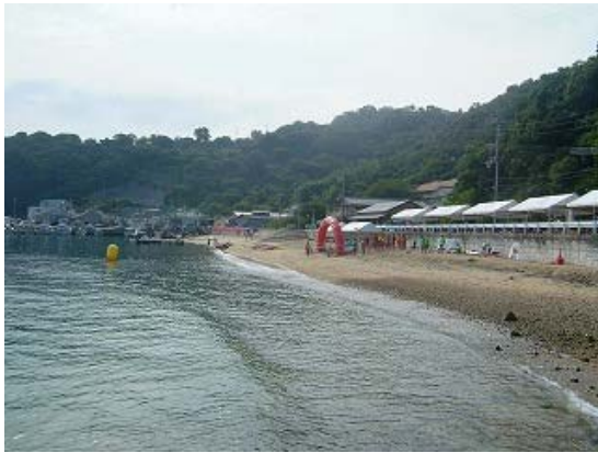
1km スタート・3.2km ゴール地点①