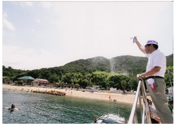
3.2km コース スターター南都副市長