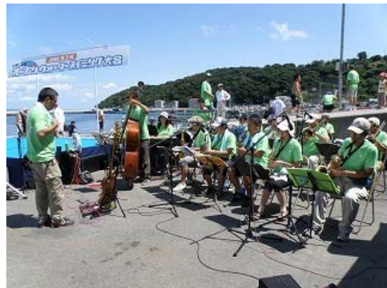
新日鐵広畑「尚和会吹奏楽部」