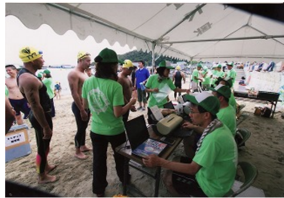
競技スタッフ（ゴール担当）