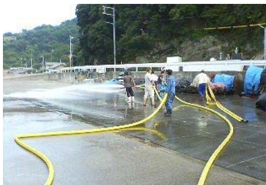
宮消防団による会場掃除風景