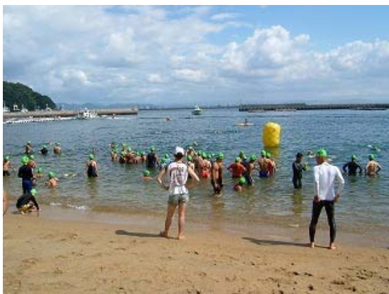
1km コース ウォーミングアップ風景