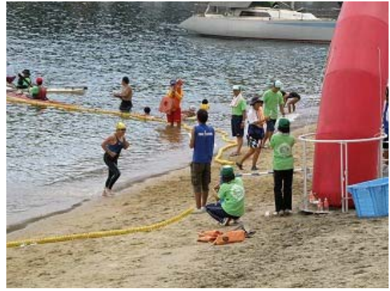
3.2km コース ゴール⑤