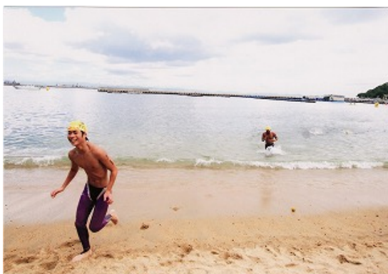
3.2km コース ゴール②