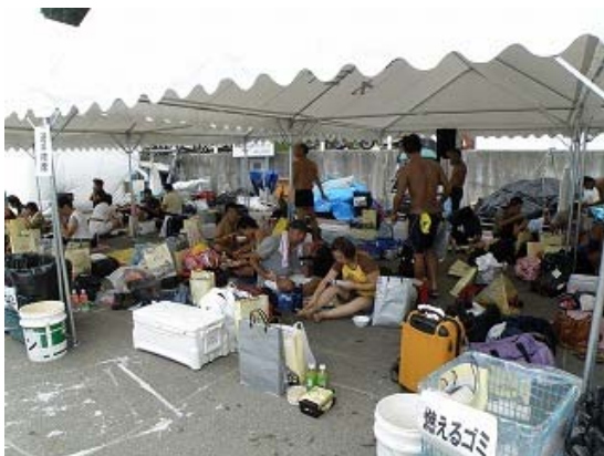
選手控えテント風景