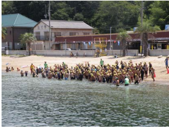
3.2km コース スタート前