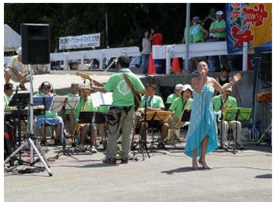
尚和会吹奏楽部によるコンサート