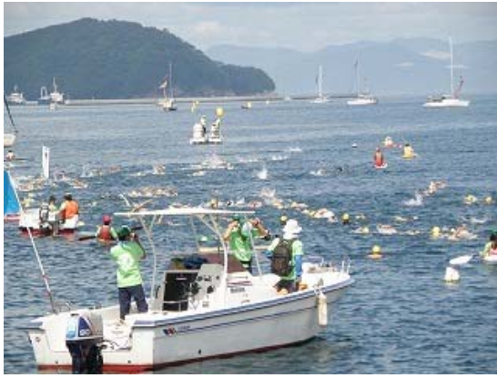
レースガードスタッフ（海上統括船）