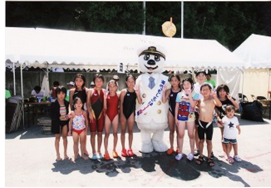
うみ丸くんと記念撮影①