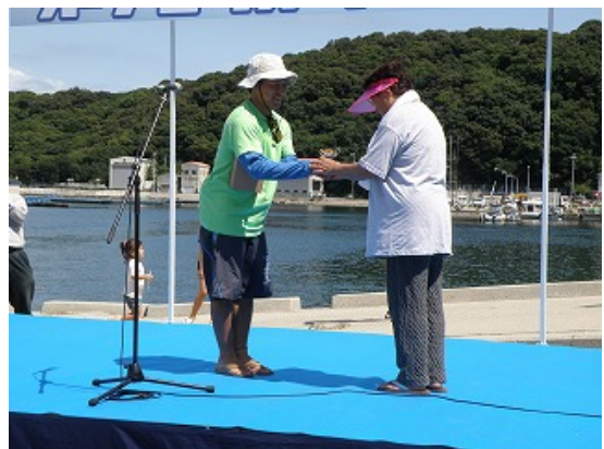
最高齢参加者へSSF（笹川スポーツ財団）賞