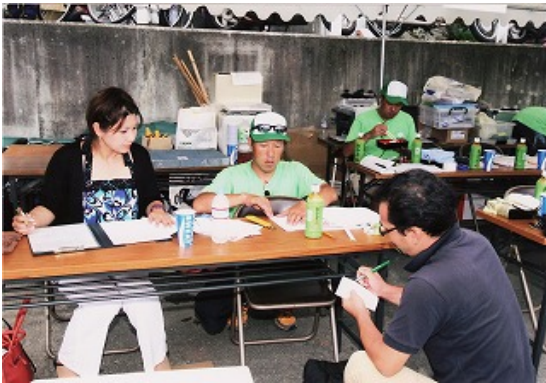
本部打ち合わせ風景