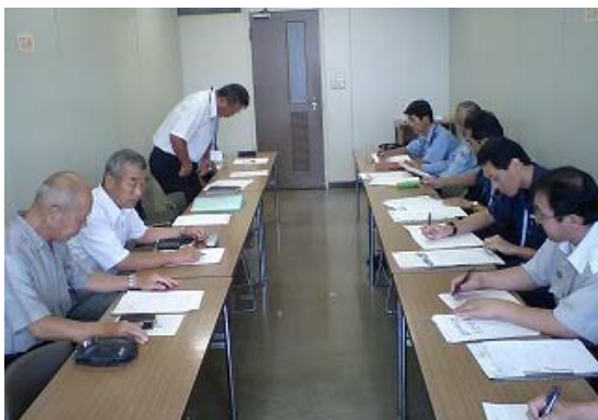
安全対策会議風景