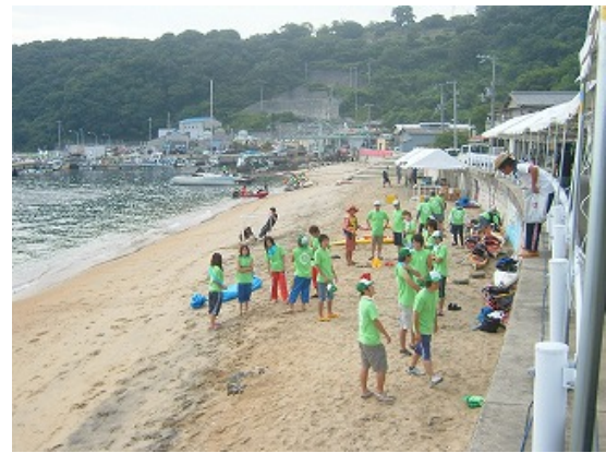
カヌースタッフ打ち合わせ風景