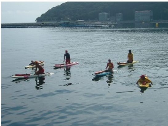
レースガードスタッフ（レスキューボート）