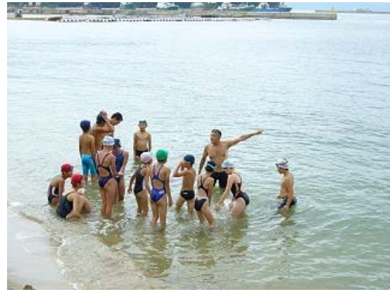
オープンウォーター講習会④