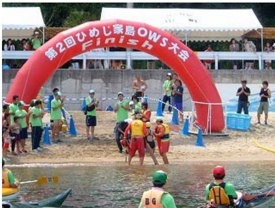
3.2km コース 最終泳者ゴール①