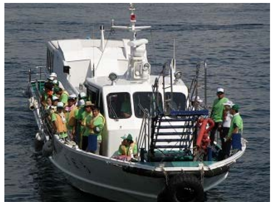
カヌースタッフ移動風景