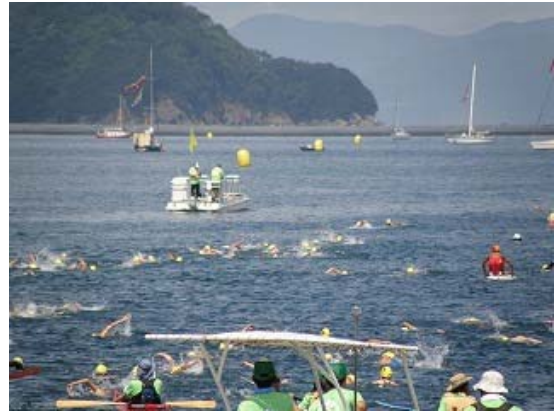
レースガードスタッフ（先導船）