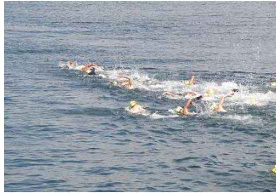
3.2km コース 先頭集団