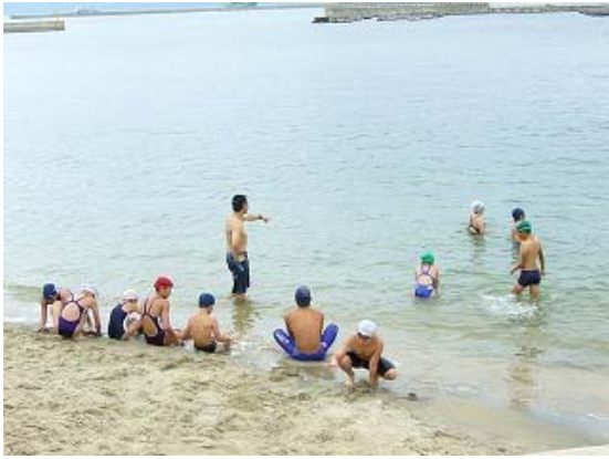
オープンウォーター講習会③