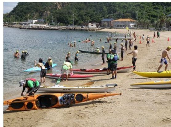
3.2km レースガードスタッフ (スタート前)