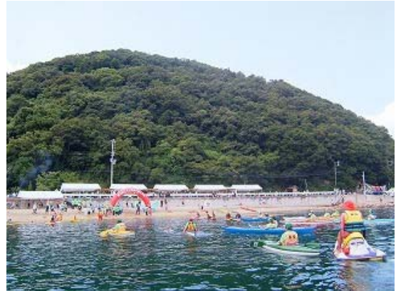
3.2km コース ゴール⑦