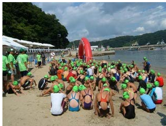
1km コース 競技説明