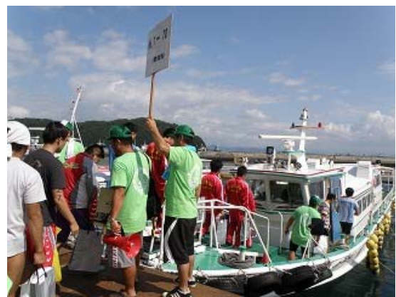
家島から男鹿島への選手移動風景①