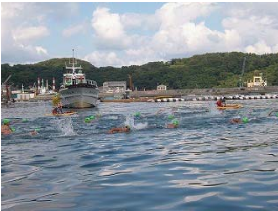
1km コース レース風景①