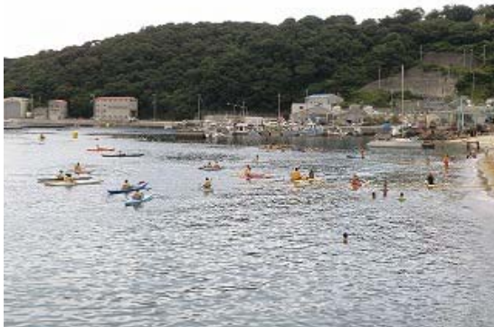
3.2km コース ゴール⑥