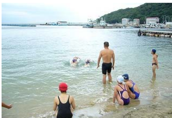
オープンウォーター講習会①