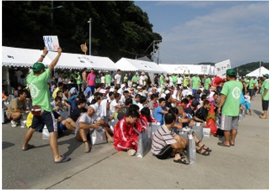
競技スタッフ（スタート担当）