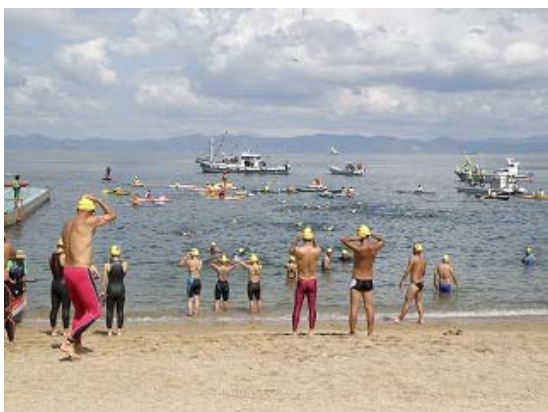
3.2km コース ウォーミングアップ風景