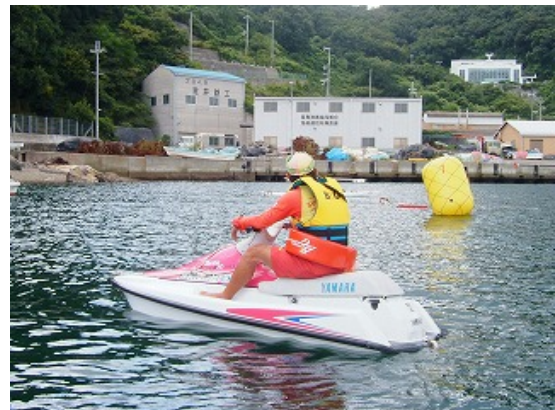
レースガードスタッフ（水上バイク）