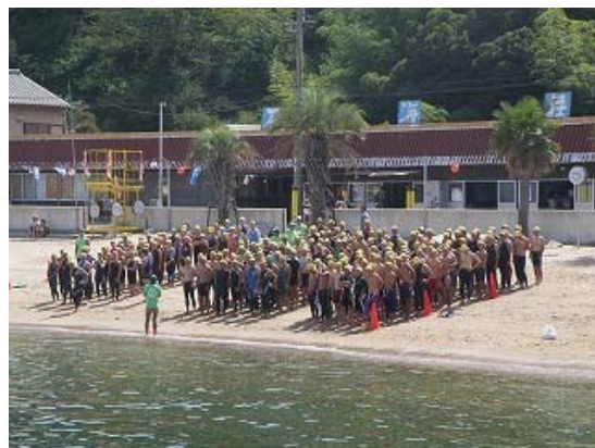
3.2km コース 選手スタート前