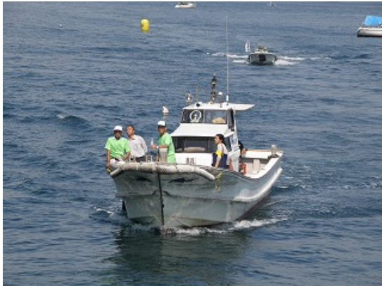
3.2km レースガードスタッフ（救助船）