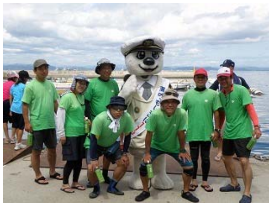
うみ丸くんと記念撮影②