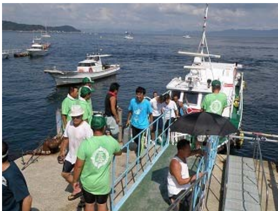
男鹿島 選手下船風景