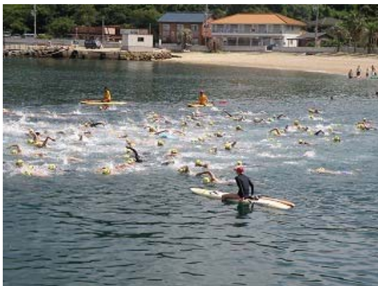
3.2km コース レース風景①