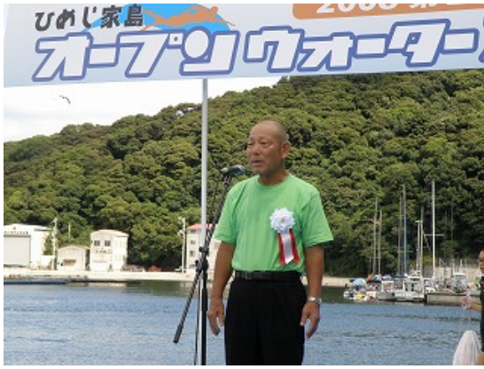
新井大会会長による閉会のあいさつ