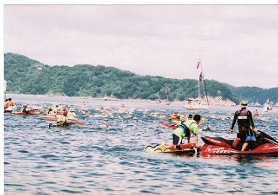
レースガードスタッフ（水上バイク・ライフスレッド）