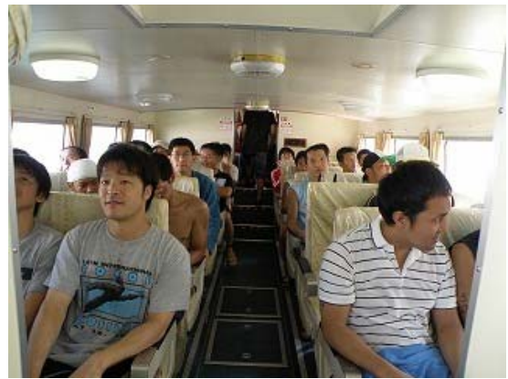
家島から男鹿島への選手移動風景（船内）