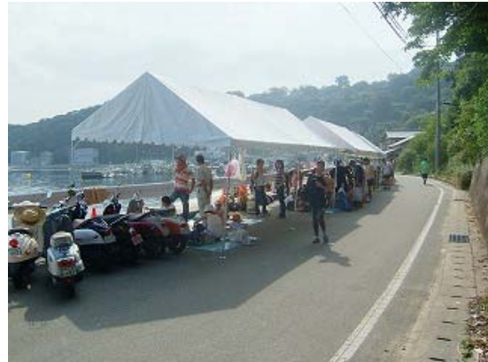
選手控え席及び観覧席