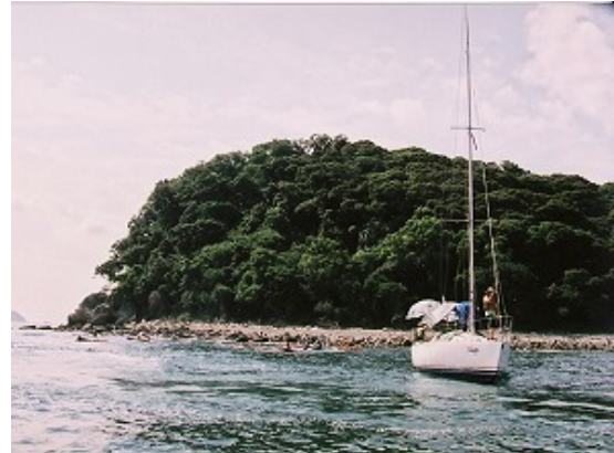
3.2km レースガードスタッフ（監視船）