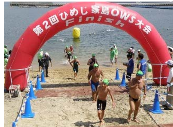
3.2km コース ゴール①