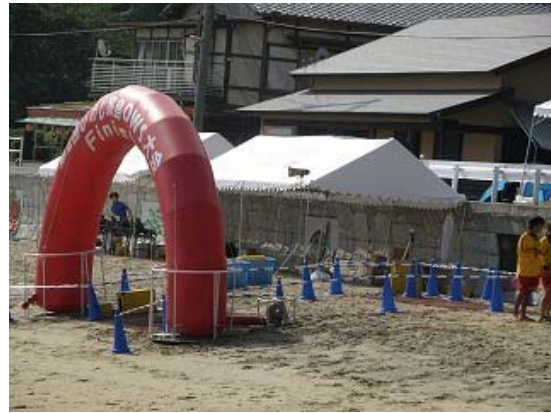
1km スタート・3.2km ゴール地点②