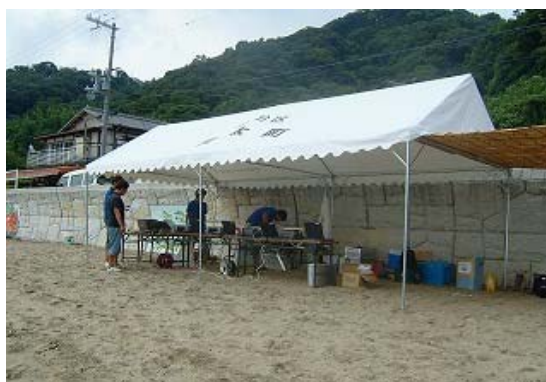
記録計測システム設置風景