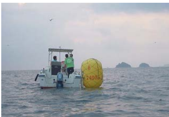
コースブイ設置風景