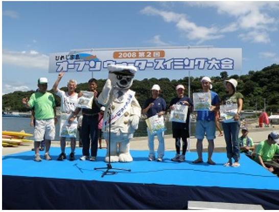
遠来賞として千葉県の6人が表彰