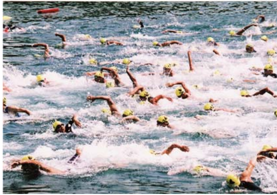
3.2km コース レース風景③