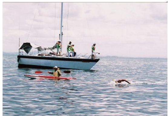
レースガードスタッフ（カヌー・ヨット）