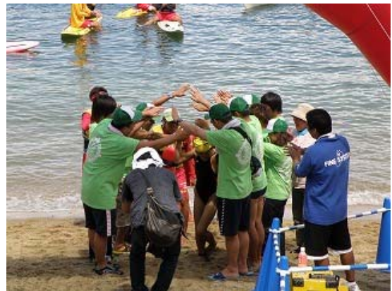
3.2km コース最終泳者ゴール②