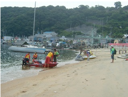
1km レースガードスタッフ (スタート前)