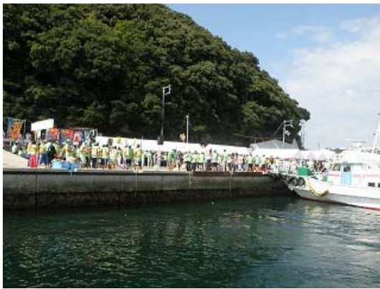
家島から男鹿島への選手移動風景②