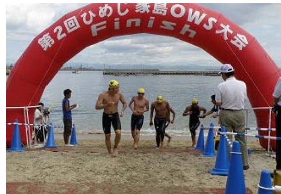
3.2km コース ゴール③