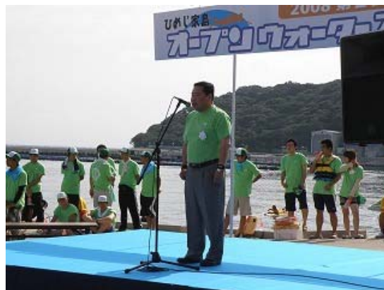
中上真浦区長による歓迎の挨拶