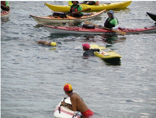
レースガードスタッフ（レスキューボート）