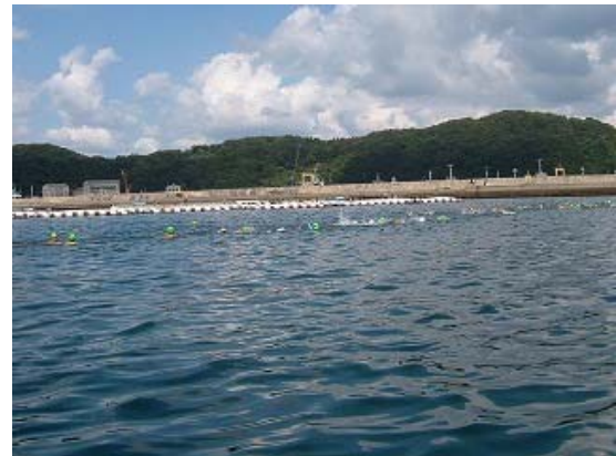
1km コース レース風景②