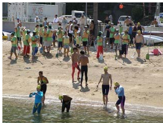
3.2km コース カヌースタッフ待機風景