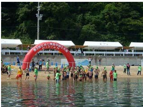
1km コース スタート前