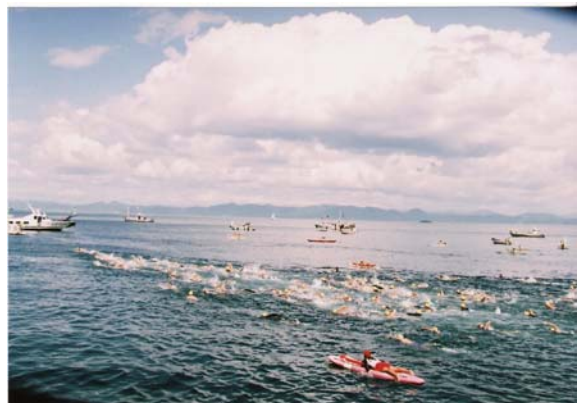
3.2km コース レース風景②