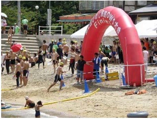
3.2km コース ゴール④