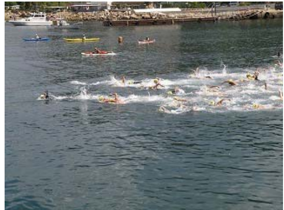
3.2km コース スタート