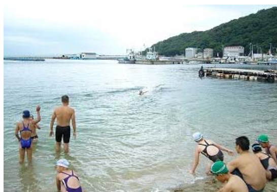
オープンウォーター講習会②