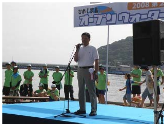
姫路市 南都副市長による挨拶