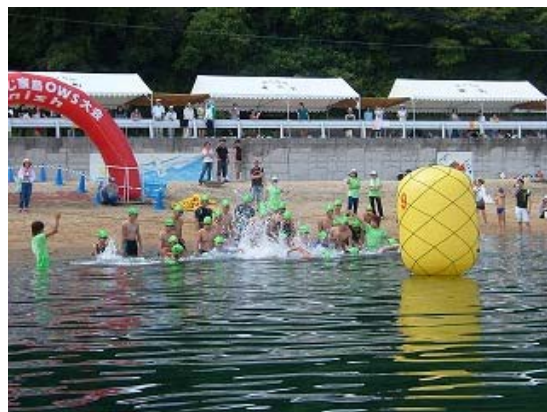
1km コース スタート