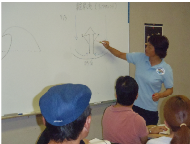
テキストを基にした座学