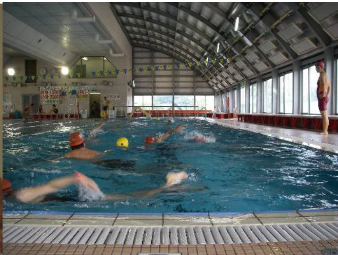
レースを想定した講習