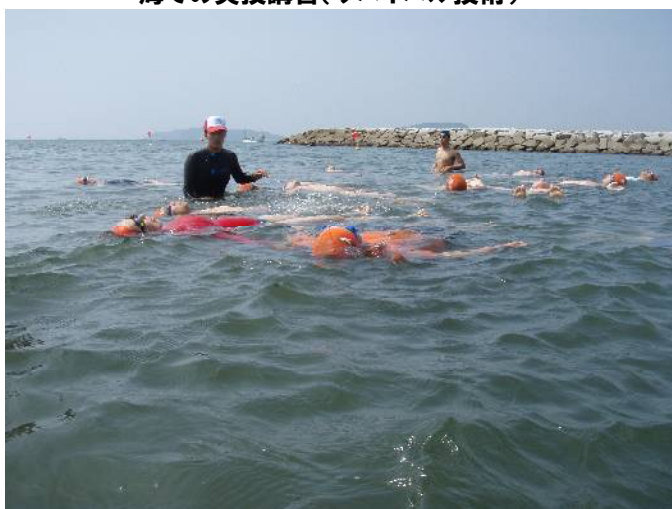
海での実技講習(サバイバル技術)