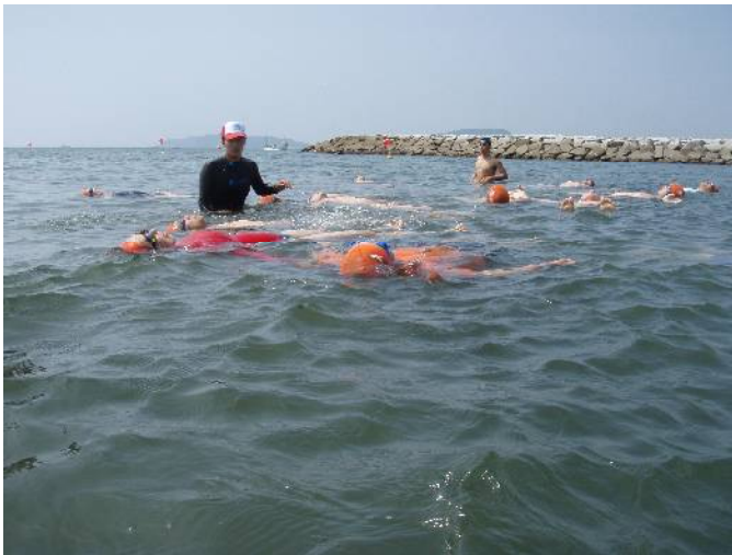
海での実技講習(サバイバル技術)