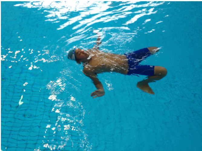
OWS検定(サバイバル背泳ぎ)