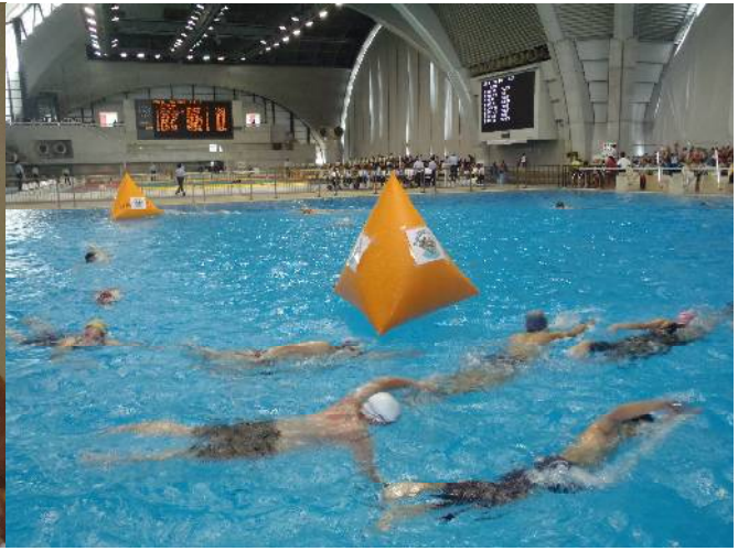
レースを想定した講習